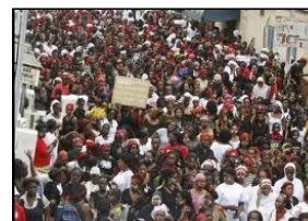
Marxa de dones per la pau. Abidjan

Entre tots i totes podem construir una cultura de pau, per fer-ho cal que establim quins són els països productors d'armament (Nord) i els principals consumidors (Sud) i perquè esdevé aquesta situació.