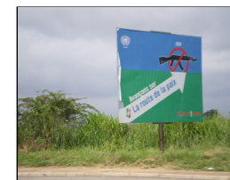
Ruta per la pau. Bouaké

Denunciem les guerres i estem en acció per a construir una pau positiva.