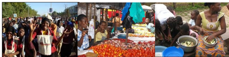
Fòrum Social Dakar

Per què hi ha fam al món? No hi ha prou aliments per alimentar tota la població? Establim quines són les causes de la fam i la subalimentació a l'Àfrica Subsahariana, atenent a les regles del joc beneficioses per a multinacionals, els desastres naturals, els conflictes armats... Quines estratègies plantegen les famílies i en especial les dones per assegurar l'alimentació dels seus membres?