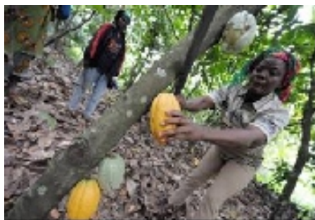
Cultius de cacau