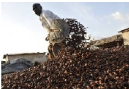
Cultius de cafè

- Propostes d'acció , a través de la realització de campanyes de sensibilització per part dels infants i joves, per tal de pal·liar aquestes desigualtats i denunciar aquestes injustícies