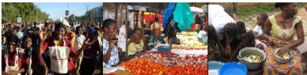
Fòrum Social Dakar

- Propostes i estratègies . La sobirania alimentària com a mitjà per a reduir la fam.