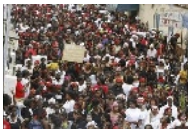
Marxa de dones per la pau. Abidjan