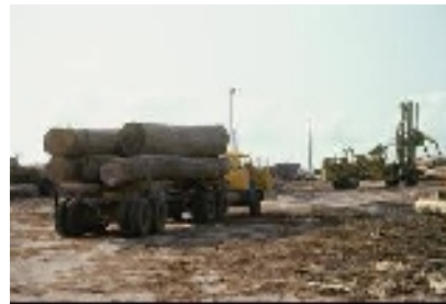
Exportació de matèries primes Port d'Abidjan