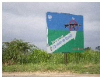
Ruta per la pau. Bouaké