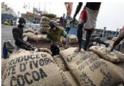
Exportació de cacau

- Proposta d'acció , a través d'una campanya de sensibilització realitzada pel jovent, sobre estratègies de comerç just , sostenible i equitatiu.