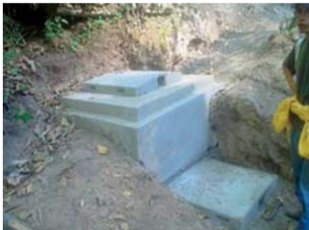
Obra de captación en fuente de agua