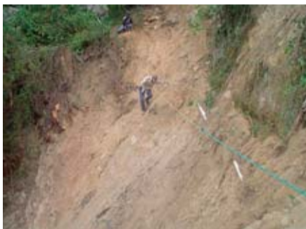
Medición paso aC7ro para tubería