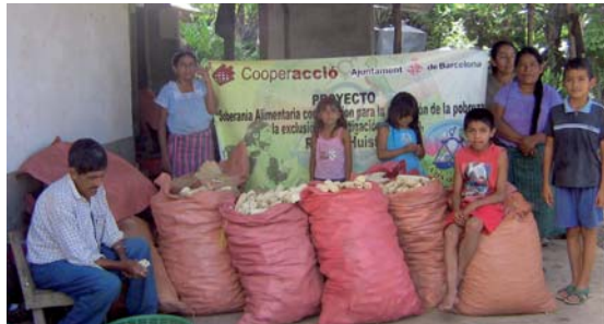
Mujeres de Huehuetenango mostrando su cosecha de maíz

Guatemala es primer productor en la región de caña de azúcar, exporta toneladas de café, bananos, brócoli, minivegetales y sin embargo el 50% de la población infantil menor de 5 años sufre desnutrición crónica. El gobierno se sigue equivocando al eliminar los aranceles en la importación de alimentos para enfrentar la actual crisis alimentaria. El autoconsumo ha sido