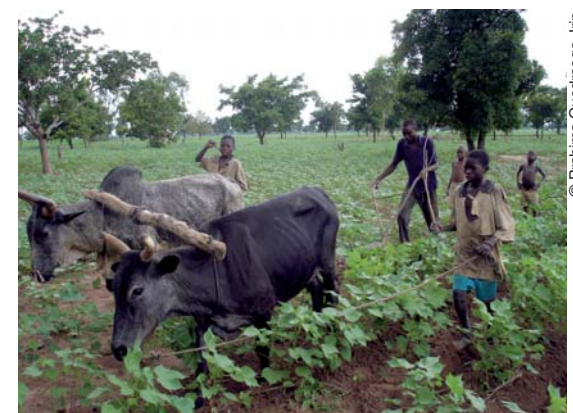
Treballadors de cotó als camps de Burkina Fasso.

Fonts: BBC, Le Monde Diplomatique, Le Courrier International, Oxfam, The Economist, FAO, ROPPA