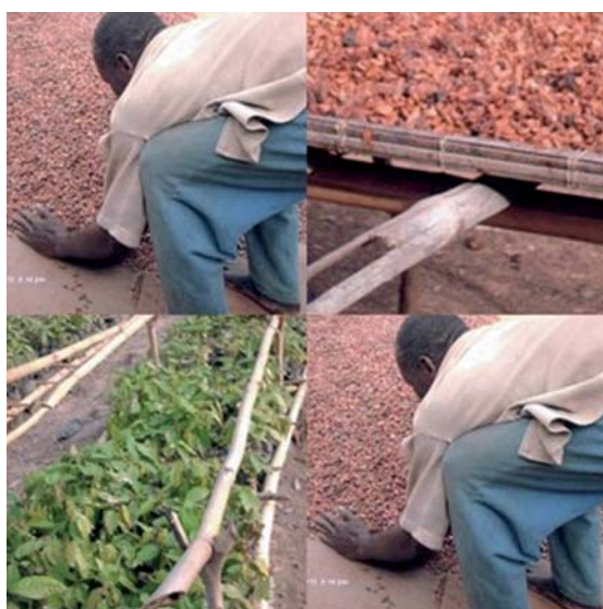
El procés de producció del cacau a Costa d'Ivori.

La guerra a Costa d'Ivori ha tingut molt a veure amb el cacau i el cacau amb la guerra. Com resumia François Ruf "tot el que és política és cacau i tot el que és cacau és política a Costa d'Ivori". Les polítiques per acabar amb els monopolis europeus del govern ivorenc,